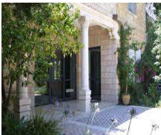
המטה של מרכז בלום לכלכלות מתפתחות במכון ירושלים.

מרכז מילקן לחדשנות של מכון ירושלים למחקרי מדיניות ממומן, בין היתר, על-ידי תרומות ממכון מילקן ומקרנות אמריקאיות וישראליות מובילות אחרות. ראש עיריית ירושלים המנוח טדי קולק, האוניברסיטה העברית וקרן ירושלים יסדו את מכון ירושלים בשנת 1978, בתור מרכז למחקר יישומי.