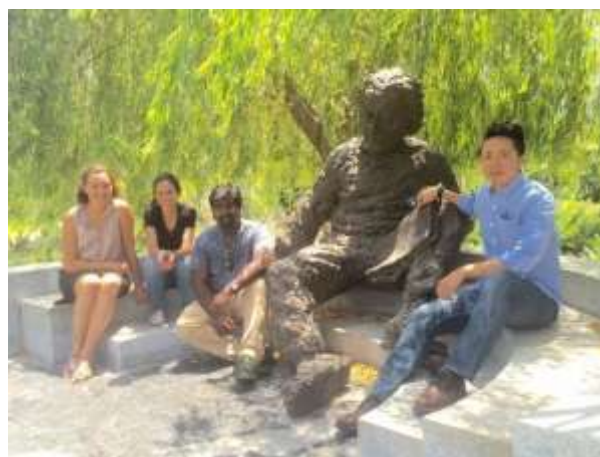
עמיתים גלובלים עובדים על פרויקטים בתחומים של מים, רשתות קטנות של אנרגיה סולרית, חקלאות חכמה המותאמת לאקלים וטכנולוגיות מסייעות בישראל.