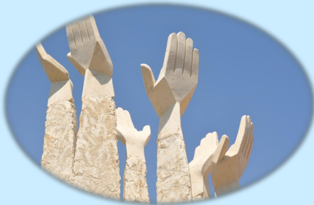
הון מעשה ידי אדם