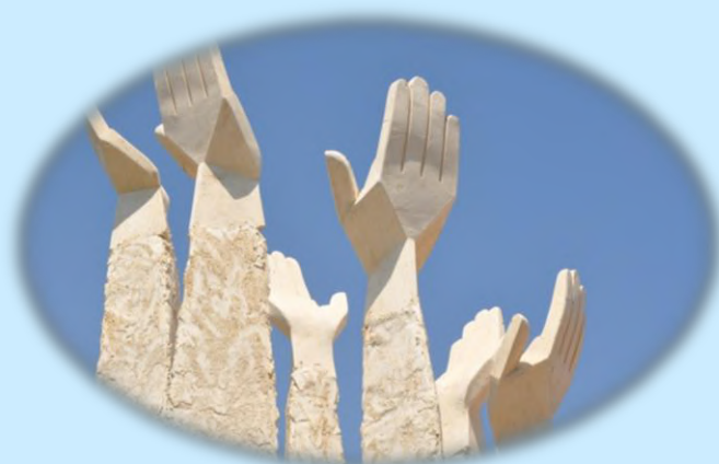
הון מעשה ידי אדם