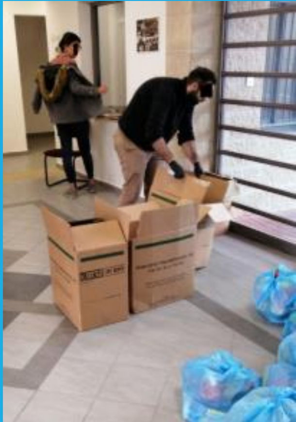
משתתפי ארגון הנוער "ילא" משתתפים בחלוקת תרומות מזון

עם התחלת תקופת הבידוד החלו נפוצות ברשתות החברתיות במזרח ירושלים שלל יוזמות קהילתיות לסיוע לתושבים בתקופה הקשה: