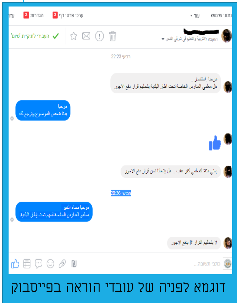
דוגמא לפניה של עובדי הוראה בפייסבוק